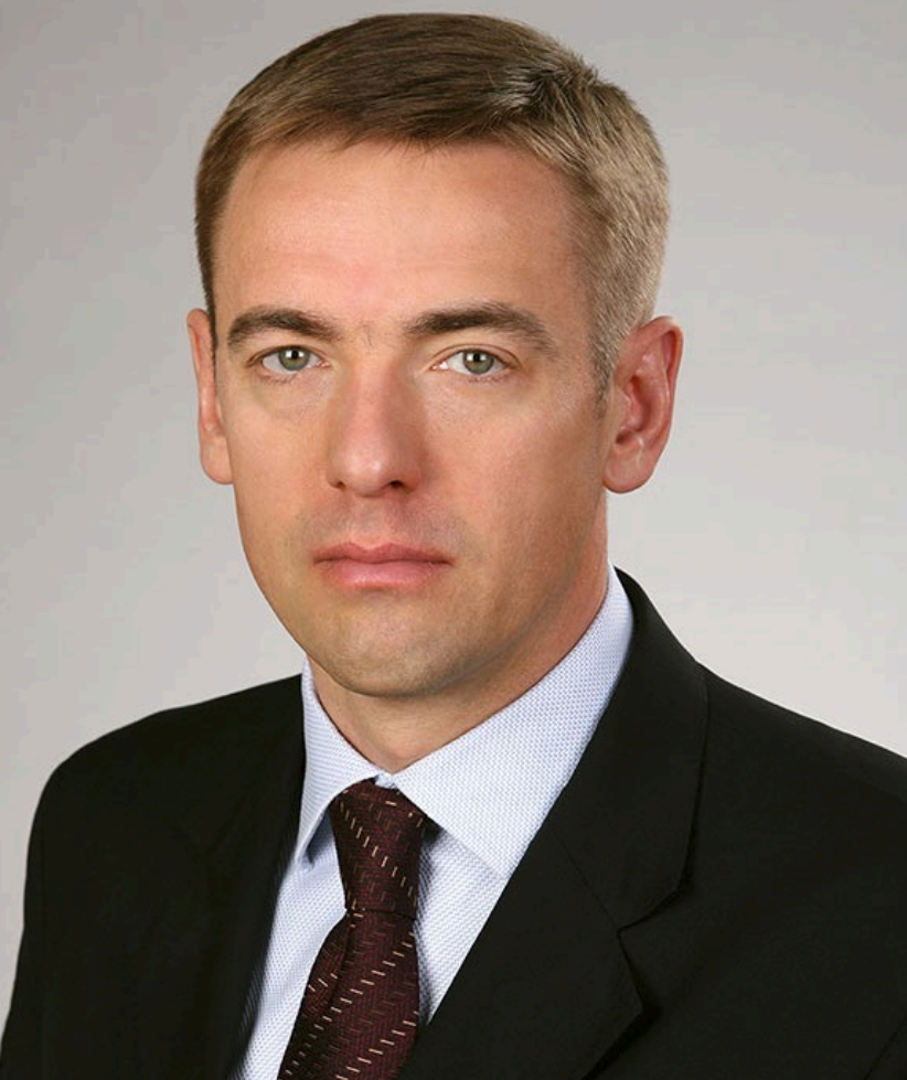
В.Л. Евтухов – статс-секретарь – заместитель Министра промышленности и торговли Российской Федерации